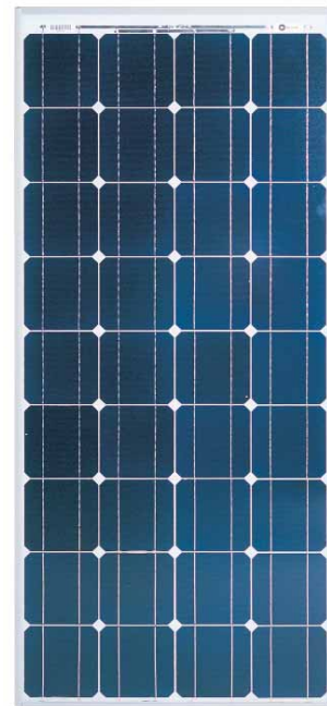
BP 785S Maßstab 1:14

Lamine sind von "Underwriter's Laboratories" für elektrische Sicherheit und Brandschutz Klasse C anerkannt.